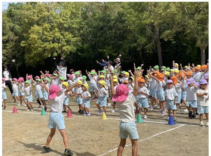
5歳児が考えてくれた体操。全園児で運動会を楽しもう。