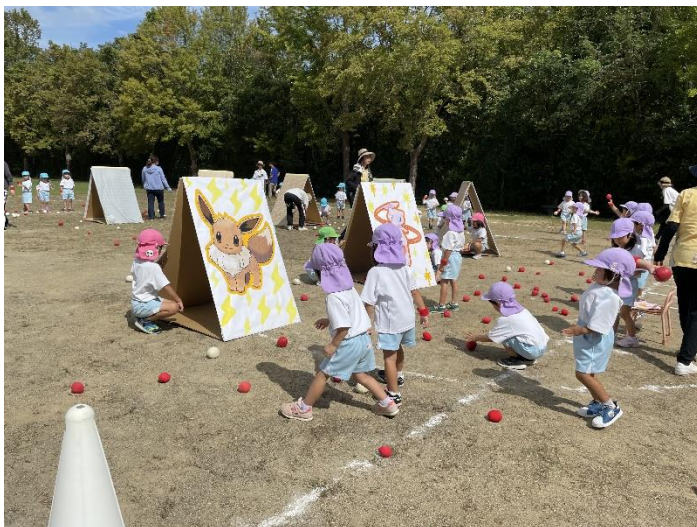
3歳児は、的をねらってボール当てを楽しみます。