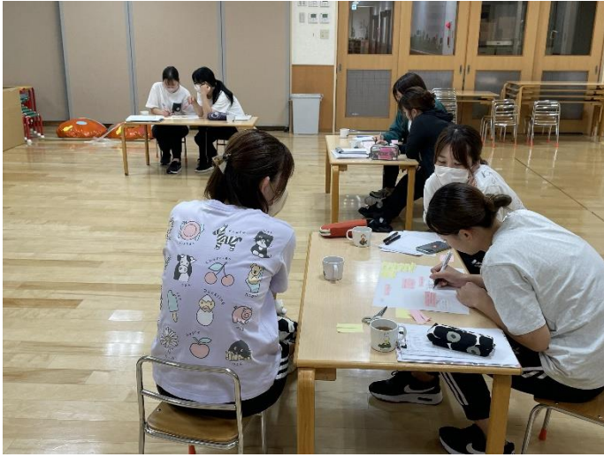
園全体で「育てていきたい子どもの姿」を話し合いました。