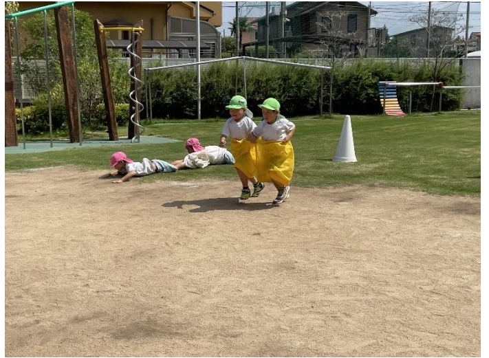
5歳児のデカパン競争！協同性が育っています。