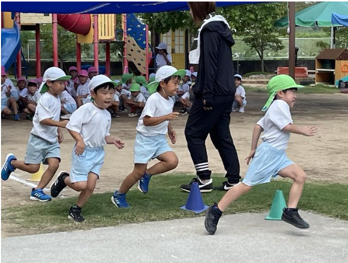
クラス対抗のかけっこ。今年は得点制で盛り上がります。