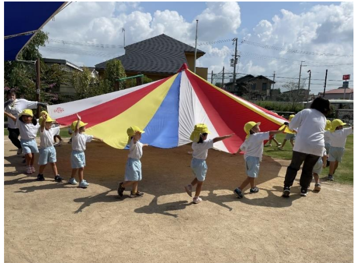
4歳児は大好きなバルーンをみんなで楽しく広げます。